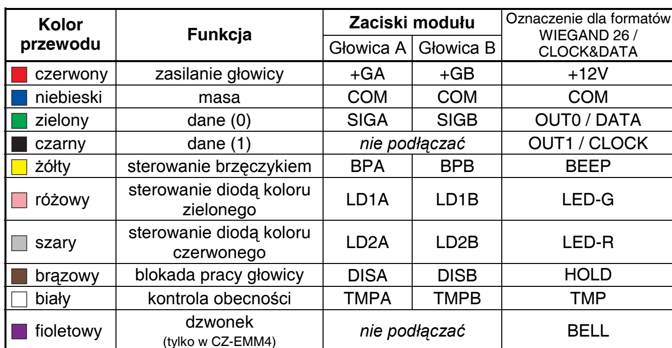
Tabela 1. Opis przewodów oraz sposób podłączenia przewodów czytnika do zacisków modułów produkowanych przez firmę SATEL.

Uwaga: Zaciski oznaczone TMPA i TMPB znajdują się na płytce elektroniki ekspandera CA-64 SR w wersji 1.6 lub wyższej. W przypadku podłączania czytnika do ekspandera wykonanego w starszej wersji (1.5 lub wcześniejszej), należy w ustawieniach ekspandera wyłączyć opcję KONTROLA GŁOWICY. Biały przewód czytnika można pozostawić niepodłączony lub podłączyć go do masy. Można też podłączyć ten przewód bezpośrednio do centrali alarmowej, aby w ten sposób kontrolować obecność głowicy. Przewód ten jest zwarty do masy w głowicy przez rezystor 2,2 kΩ. Wejście, do którego przewód ma zostać podłączony w centrali, należy zaprogramować jako „24H sabotażowe” i odpowiednio dobrać typ linii.